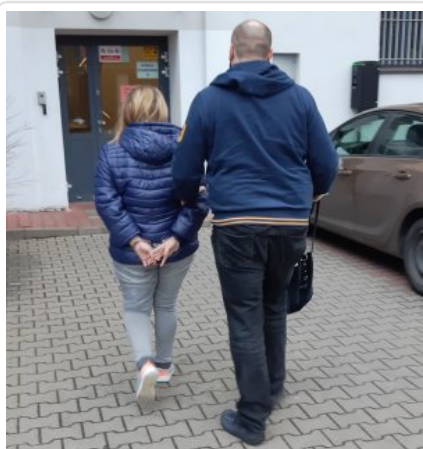
Policjant wykonuje czynności z zatrzymaną kobietą

Godna pochwały jest postawa pary mieszkańców stolicy, którzy zapobiegli tragedii na drodze. To dzięki ich szybkiej reakcji 42-letnia obywatelka Ukrainy, która prowadziła samochód mając ponad 2,5 promila alkoholu w organizmie, nie uniknie odpowiedzialności karnej. Usłyszała już zarzut prokuratorski, za który sąd może orzec zakaz prowadzenia pojazdów mechanicznych, wysoką grzywnę, i nawet do 2 lat więzienia.