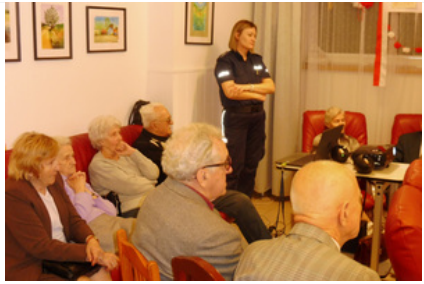
Policjantki prowadzą zajęcia z seniorami