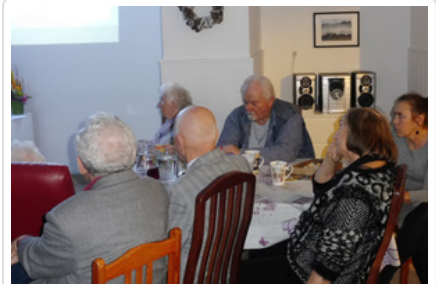
Policjantki prowadzą zajęcia z seniorami