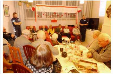
Policjantki prowadzą zajęcia z seniorami