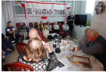
Policjantki prowadzą zajęcia z seniorami