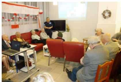
Policjantki prowadzą zajęcia z seniorami