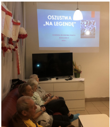
Policjantki prowadzą zajęcia z seniorami