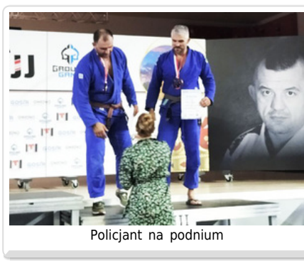
Policjant na podium