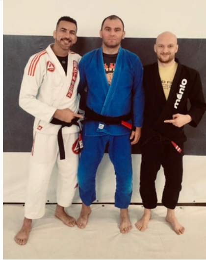
Nominacje na czarny pas w BJJ