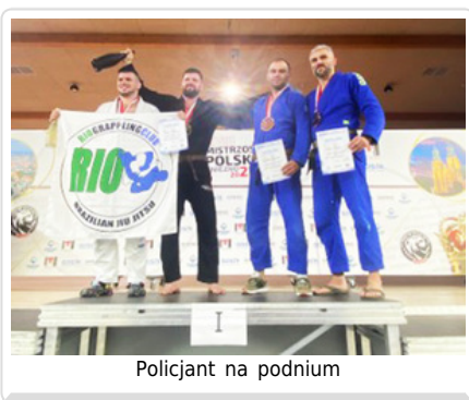
Policjant na podium