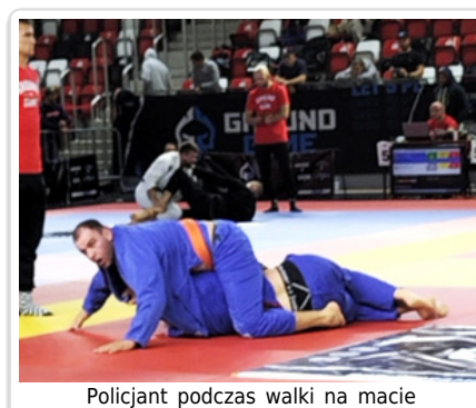
Policjant podczas walki na macie