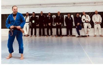
Nominacje na czarny pas w BJJ