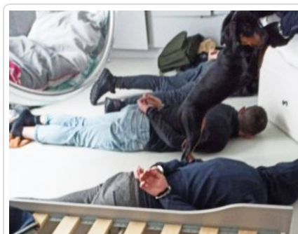
Policjanci z zatrzymanymi mężczyznami