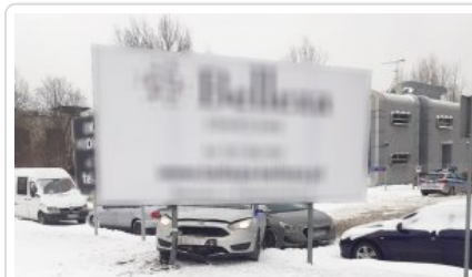
Zabezpieczony przez policjantów ford z narkotykami