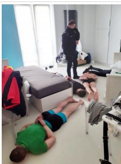
Policjanci z zatrzymanymi mężczyznami