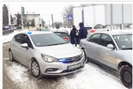
Policyjne działania na miejscu zatrzymania podróżujących fordem z narkotykami